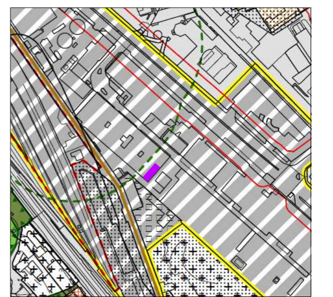
Estratto Tavola P.d.R. n. 15.1. immobile oggetto di cambio destinazione d'uso senza opere